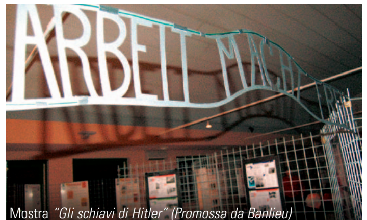
Mostra "Gli schiavi di Hitler" (Promossa da Banlieu)

La Biblioteca Comunale è anche luogo di incontro, di crescita e di condivisione. In questa pagina, immagini scattate durante lo svolgimento di alcune attività promosse dalla biblioteca.