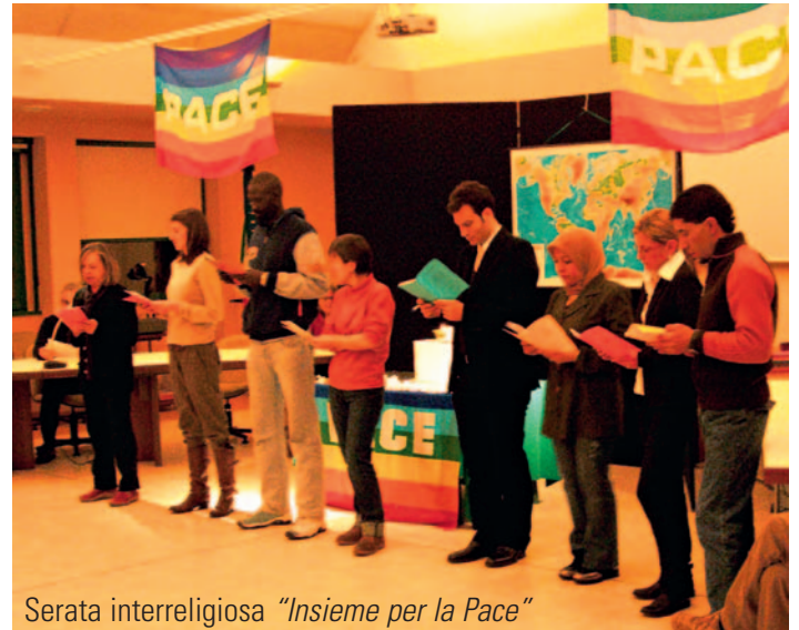
Serata interreligiosa "Insieme per la Pace"

L'Amministrazione intende coinvolgere i cittadini in questo processo e renderli partecipi delle decisioni. Verranno pertanto organizzate assemblee pubbliche e si promuoverà il dibattito per poter fare emergere le idee di tutti i cittadini. Chiediamo soltanto che, accantonati gli egoismi personali, le proposte scaturiscano dal desiderio di lasciare ai nostri figli un paese serenamente vivibile. Invitiamo pertanto la cittadinanza a iniziare sin d'ora a interrogarsi su questa tematica fondamentale.