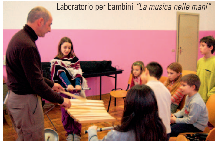
Laboratorio per bambini "La musica nelle mani"